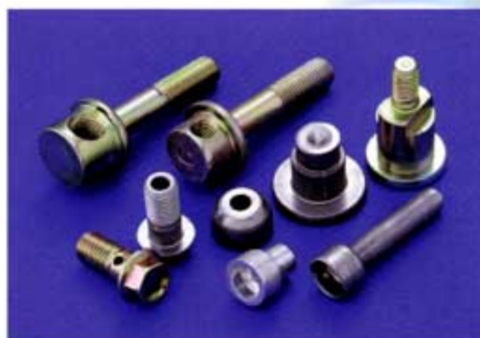
◆5段パーツフォーマー製品