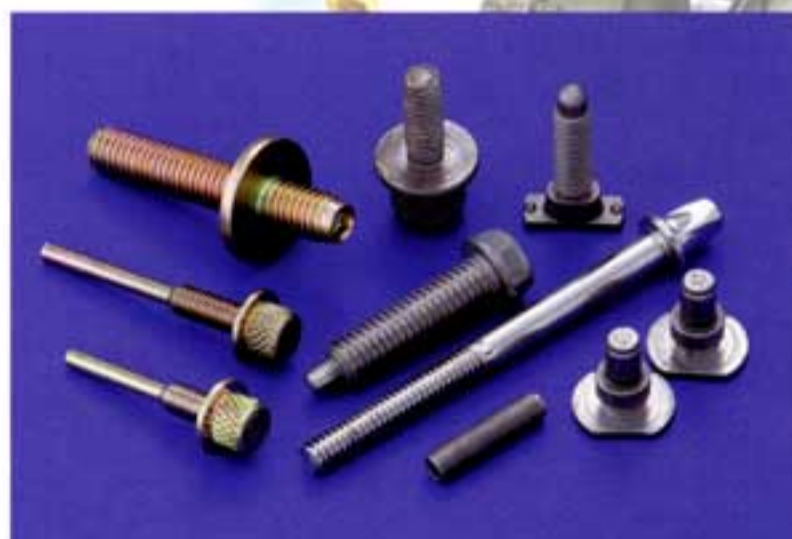
◆2ダイス3ブロー製品