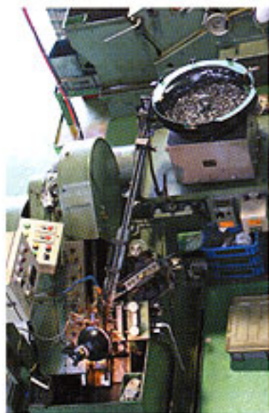
工場内製造ライン