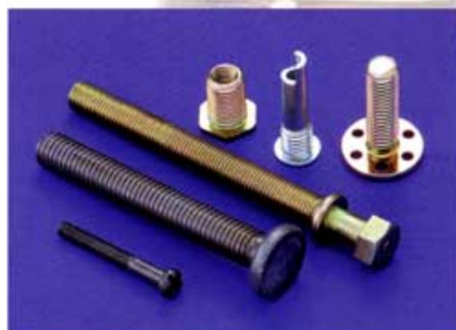
◆1ダイス2ブロー製品